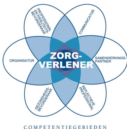
Figuur 1. CanMEDS-systematiek

In dit Expertisegebied wordt bij elke Canmedsrol een korte, algemene beschouwing op de rol van de verpleegkundige binnen het expertisegebied IC beschreven. Vervolgens worden per rol in grote lijnen de generalistische kennis en vaardigheden uit het (basis)beroepsprofiel beschreven. Daarna worden per rol de aanvullende, specifieke kennis en vaardigheden beschreven die een helder beeld geven van hetgeen de IC-verpleegkundige uniek maakt ten opzichte van verpleegkundigen in andere expertisegebieden. De generalistische kennis en vaardigheden uit het (basis) beroepsprofiel vormen samen met de beschrijving van aanvullende kennis en vaardigheden/attitude van de IC-verpleegkundige één geheel, en bestrijken samen het volledige gebied waarin de IC verpleegkundige werkzaam is.